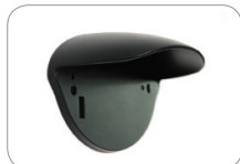
WC_HR50 Крышка датчика HR50 для работы в плохую погоду